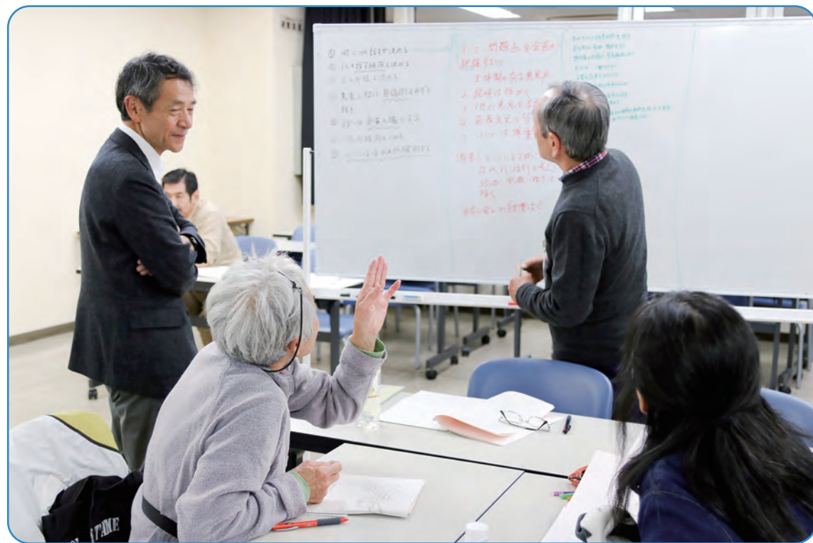
杉並の課題を、区役所職員が、区民の皆様と一緒に話し合う様子