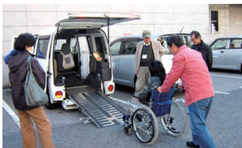
「福祉車両運転協力員講座」の様子