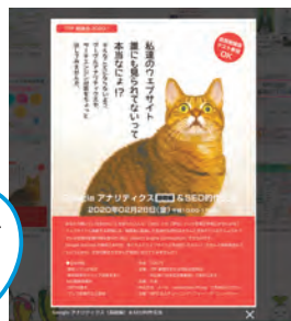
チラシ画像検索ページイメージ

楽しく検索できる「チラシ検索」がイベントコーナーのなかにあります。文章だけではわかりにくい情報や、時間のない方にオススメです。パラパラめくって、はっと目にとまるステキな情報を見つけましょう。