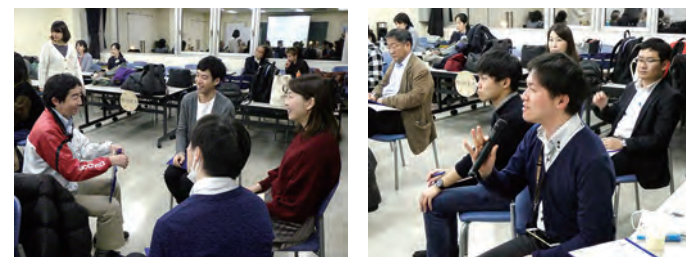
「まちとつながる!まちあわせカフェ」の様子

“ボランティア”に対する人々の意識が、「自分が」やりたいからやる。自分のできること・あるいは興味のあることで、社会参加していきたい」という感覚に変わりつつあります。そうした中で、「まち」で何かをしたいけれど、何をしたいのかわからない、どのように活動をスタートすれば良いのかわからない、という方々も増えてきました。すぎなみ地域大学は、そんな方々の「まち」に飛び出すはじめての一步を後押しする学びの場として開設され、現在では多くの卒業生が学んだ知識を活かし、ボランティアとして様々な「まち」を彩る活動に参加しています。あなたもすぎなみ地域大学で学び、「まち」に関わるはじめての一步を踏み出してみましょう!