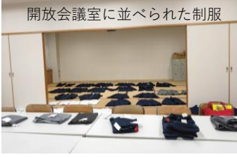
開放会議室に並べられた制服

実行委員会、今年度の役員選出方法が決まると、選挙委員会は、PTA会員に選挙の公示と共にその方法を知らせます。(会則・役員監査選挙規定第4条②) 立候補者は、会則にのっとり活動ができる事が原則となります。会則はHPにアップしてありますので、ごらんください。