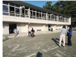
十分な距離を保ち、課題を提出する保護者。