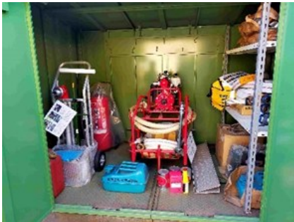
&lt;格納庫点検及び整理&gt;