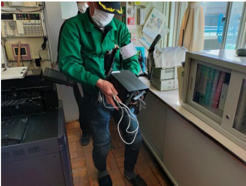
9. IP無線機の職員室からの持ち出し