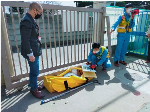
13. 応急水栓（スタンドパイプ）設置