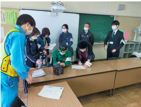
11. 総括班のIP無線機使用訓練の様子