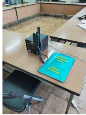
12. IP無線機と使用マニュアル