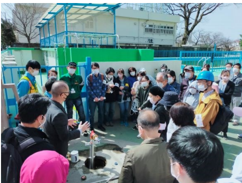
15. 防災課による説明