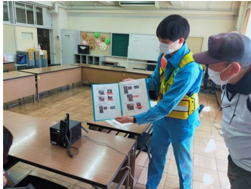
10. 防災課によるIP無線機使用方法説明