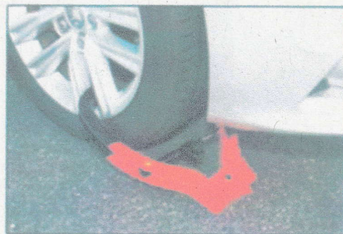
タイヤロックを取り付ける