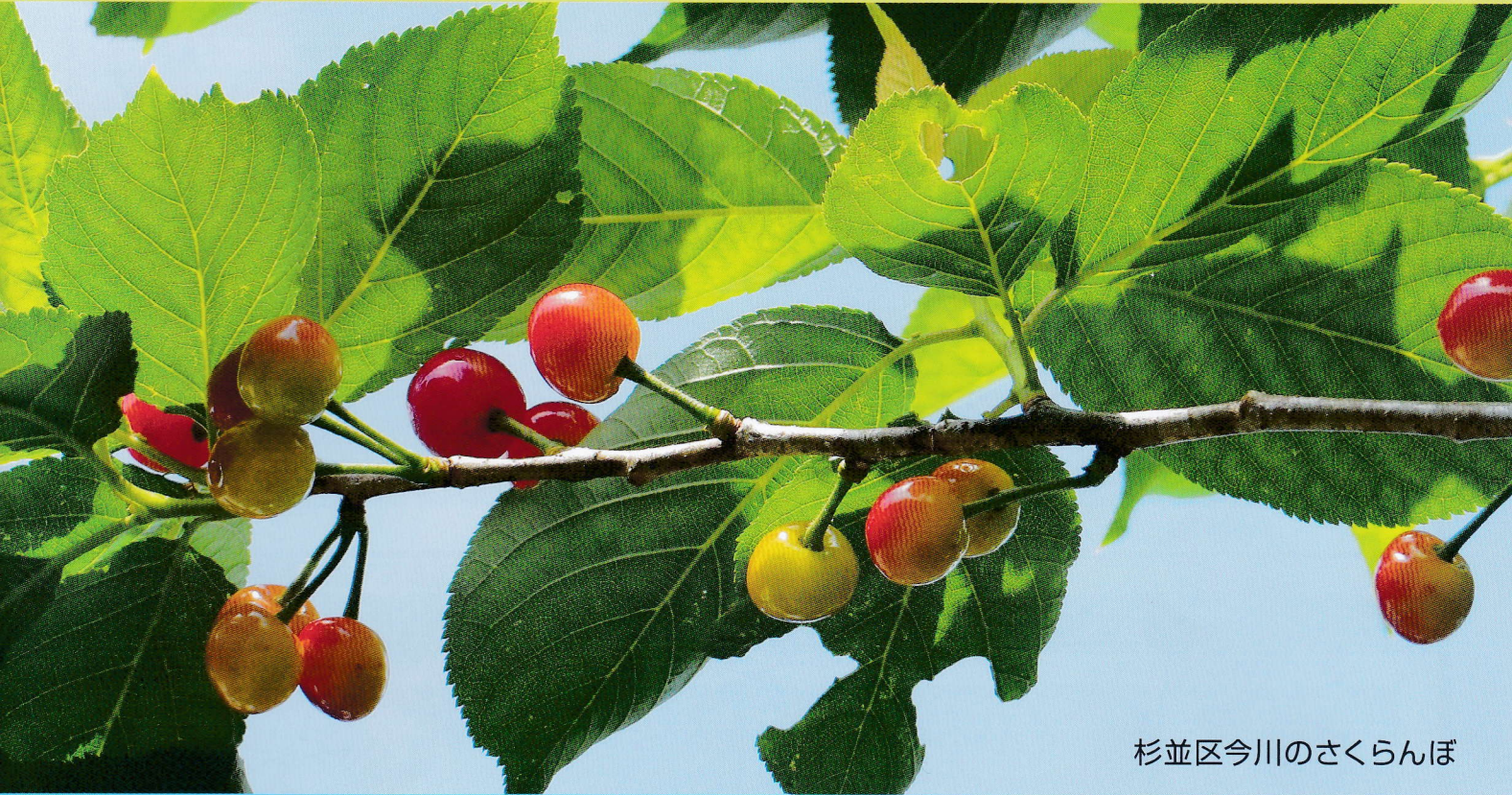
杉並区今川のさくらんぼ