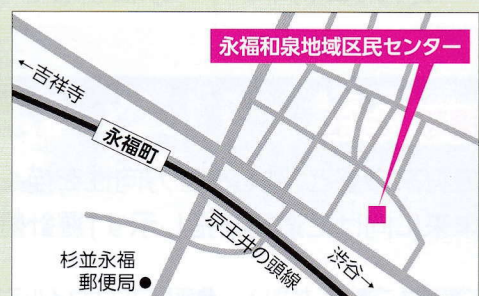
永福和泉地域区民センター (和泉3-8-18) 6月30日(水) 午後5時から