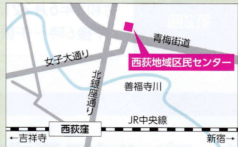
西荻地域区民センター (桃井4-3-2) 6月24日(木) 午後5時から