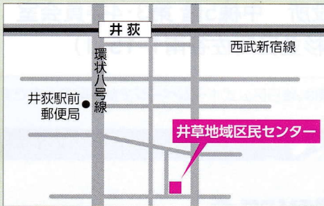
井草地域区民センター (下井草5-7-22) 6月23日(水) 午後5時から

(申込方法) 電話、FAX、Eメールで受付けています。FAX、Eメールでお申込みの際は①件名「委員説明会」、②希望回、③郵便番号・住所、④氏名(フリガナ)、⑤年齢、⑥電話番号⑦託児・手話通訳を希望する方はその旨を明記してください。第1回は6月11日正午までに、第2回は6月15日正午までに企画課へ