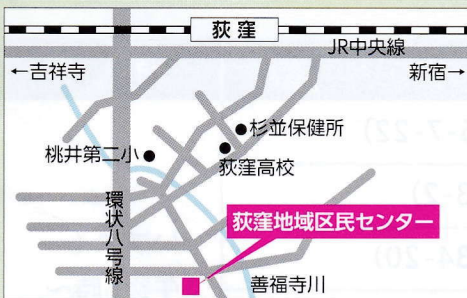
荻窪地域区民センター (荻窪2-34-20) 6月25日(金) 午後5時から