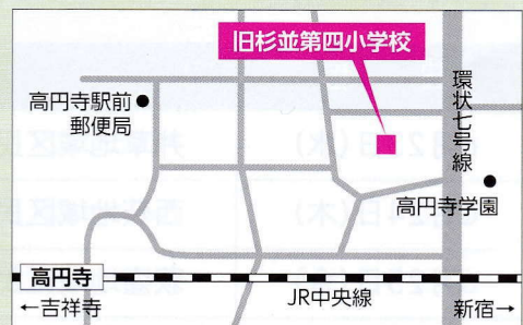
旧杉並第四小学校 (高円寺北2-14-13) 6月28日(月) 午後5時から