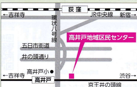
高井戸地域区民センター (高井戸東3-7-5) 6月29日(火) 午後5時から