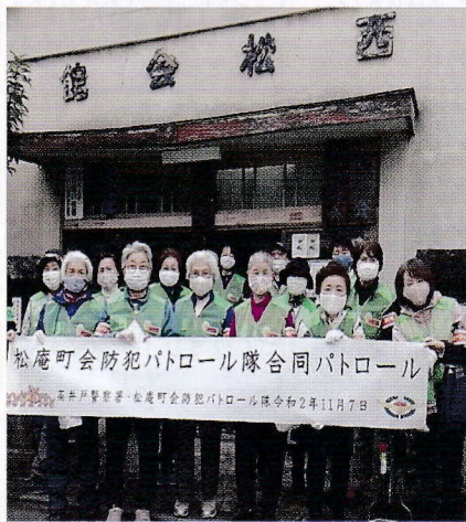
防犯パトロール隊