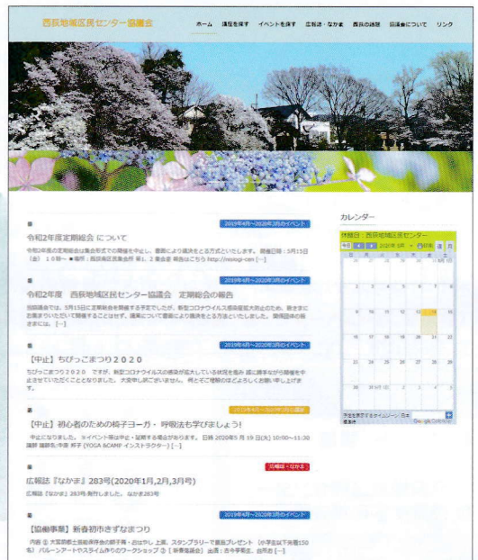
西荻地域区民センター協議会のホームページ

地域交流部は、地域の皆様のコミュニティ作りを図ることを目的に相互交流を深める場を提供しています。例年センターまつりやちびっこまつりなど様々なイベント開催の企画・運営をしています。