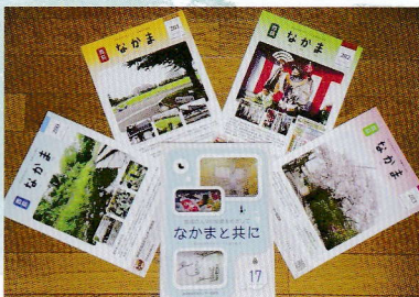
広報誌『なかま』『なかまと共に』

広報部は、広報誌「なかま」の編集・発行と協議会公式ホームページの運営を中心に活動しています。