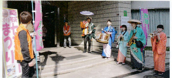
西荻センターまつり

地域交流部は、地域の皆様のコミュニティ作りを図ることを目的に相互交流を深める場を提供しています。例年センターまつりやちびっこまつりなど様々なイベント開催の企画・運営をしています。