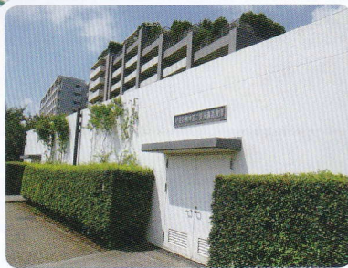
桃井第二災害備蓄倉庫