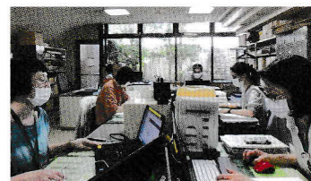
協議会事務局・西荻地域活動係