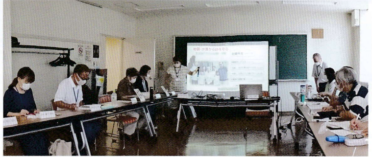
毎月行われる委員会

来年4月から活動する協議会委員を募集する予定です。詳しくは広報誌「なかま」285号(12月15日発行予定)をご覧ください。