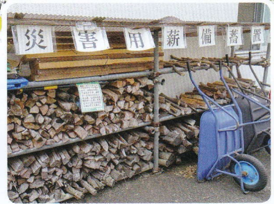
桃井原っぱ公園管理棟

新型コロナウイルス感染症の流行に伴って、西荻南区民集会所におけるイベント等について延期・中止いたしました。また、広報誌「なかま」6月15日号の発行も中止しました。