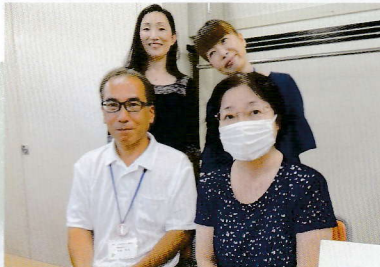
講座運営部のメンバー

講座運営部は、地域への愛着度向上を目指して地域を「知る」「学ぶ」「楽しむ」をモットーに様々な講座を企画しています。部員全員で仲良く楽しく活動しています。