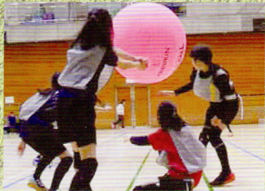
キンボールスポーツ交流大会

近年、スポーツを楽しむ人が増えてきました。スポーツといっても、早朝の公園でのラジオ体操から本格的な競技のためのトレーニングまでその種類は様々です。また、区内には多くの運動場や体育館などの施設があり、多くの人々が日々汗を流しています。かつてはプロ野球や六大学野球の試合が開催された野球場もありました。