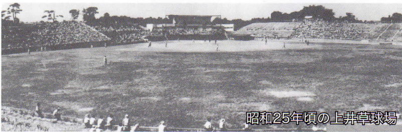
昭和25年頃の上井草球場

今年は東京2020オリンピック・パラリンピックもあり、スポーツが注目される一年になりそうです。