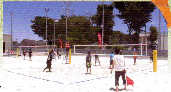
永福体育館ビーチコート

本展では、杉並区のスポーツの歴史と、近年区内で活性化している競技を中心にその現況を紹介するとともに、それらを支える体育施設について紹介します。