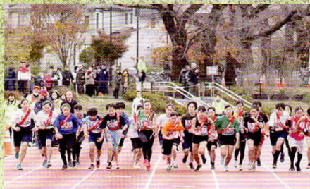
中学校対抗駅伝大会