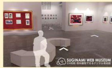
戦略的アートプロジェクトHP

協働事業では、文化芸術活動の活性化・区民の気軽なアート参加をテーマに行いました。地元のアーティスト紹介、ファンミーティング開催、杉並デザイングッズの企画等、登録メンバーとともに現在でも活動を継続中です。夏のものづくりワークショップ、秋のライトアップイベント「BATA ART EXHIBITION & Workshop」、また、区役所本庁内に展示されたアート作品を登録メンバーのガイド付きで巡る庁内アートツアーも好評を博しています。2020年には、仮想美術館(スギナミ・ウェブ・ミュージアム)を開設し、杉並ゆかりの棟方志功、中川一政はじめ多くの芸術家作品も展示中です。