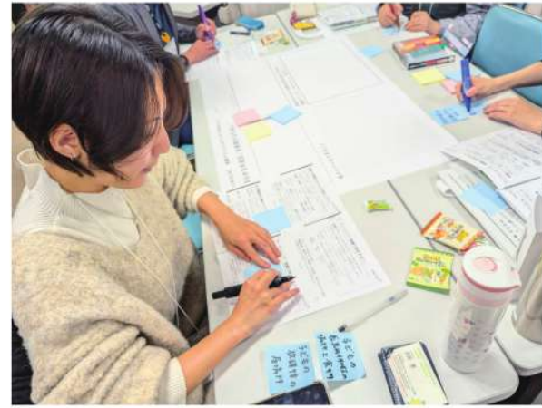
より良い杉並区の実現のために、アイデアを書きだす参加者

ワークショップでは、講義でも話に出た複雑多岐な問題を、ランダムに集められたグループで解決していくという「疑似協働体験」をしました。