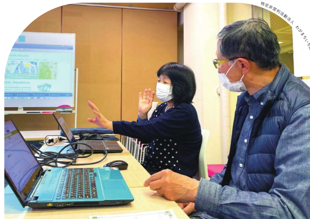
特定非営利活動法人 わがまちおぼんのかみ