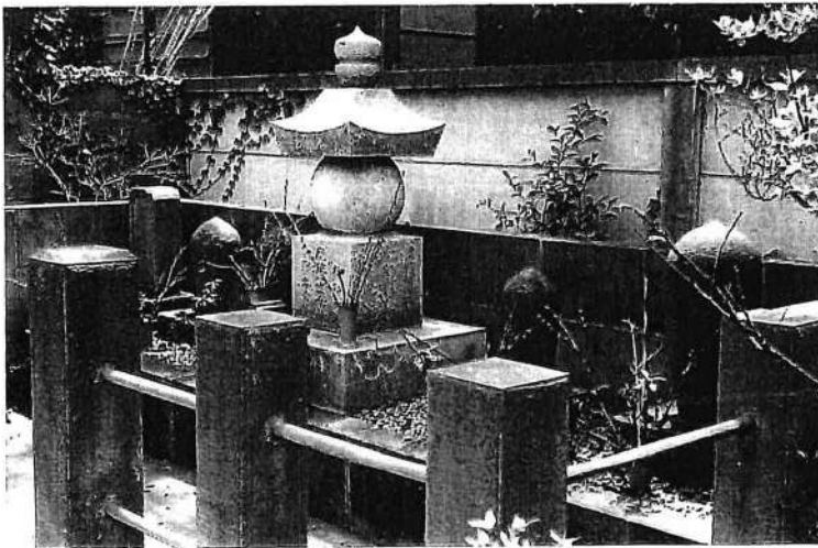
円光寺跡の住職墓地

松庵新田が開墾された時代に、現境内の西側にあった円光寺の一隅にあり、明治維新で神仏分離が続いて起きた。廃仏毀釈の為、円光寺が廃寺になり、稲荷神社は独立した。円光寺の床下より狐のミイラが発見され、お稲様のお使いの狐を祀っています。