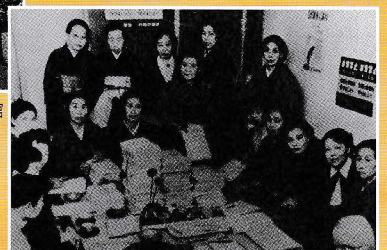
公民館の館長室で署名簿を整理する女性たち