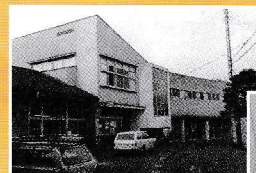
昭和40年当時の杉並区立公民館