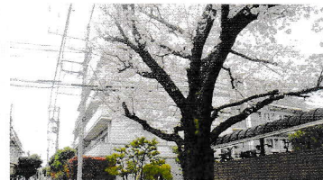
小さな十字路に立つ桜

井の頭街道沿いの永福町駅から北に走るバス通りは方南通りにぶつかります。バス通りと並行に荒玉水道があります。4本の道路を結ぶ南北に長い長方形の中心近くの十字路に、杉並区保護樹木のタグが付いた桜の老木があります（表紙参照）。高度成長期はこの周辺は製鉄会社の社宅が並んでいました。平屋で庭があり、それぞれの庭には桜の木が植えられていました。八百屋や米屋、植木屋などの店もあり生活感のある一画でした。昭和から平成になり、社宅は姿を消し住宅が建ち桜の木の数も減りました。そして、さらにマンションの建設により桜の木はほぼ伐採されました。保護樹木の桜は生き残りです。時代の変化を見つめ生き残ってきました。この桜に魅せられマンションに住まいを決めたという新しい住民もいます。この先も残された桜が住民に愛され町の変化を見続けられるように祈りたいと思います。