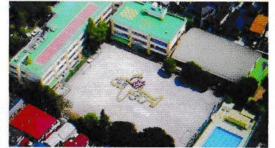
新泉小学校航空写真

跡地は杉並区震災救護所として指定され、震災等の救護の要の場所になっています。また校庭の一部は高齢者施設になっています。その駐車場の角、記念碑の真上に1本の桜の木があります。これは旧新泉小学校の校庭に咲いていた桜を移植したものです。子どもたちの成長を見守ってきた桜は今、高齢者をやさしく見守っているように思えるのです。