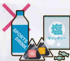
運動会やスポーツ大会への 飲食物の差し入れ