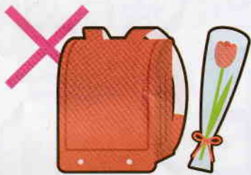
入学祝い・卒業祝い