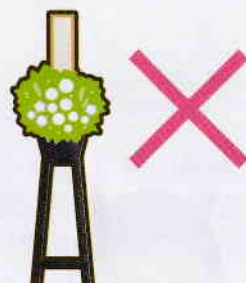
葬式の花輪・供花