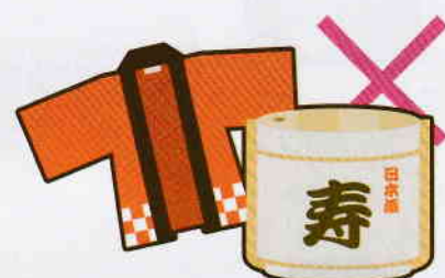
お祭りへの寄附や差し入れ