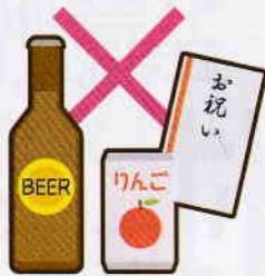
町会の集会や旅行等の 催し物への寄附や 飲食物の差し入れ