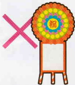
落成式・開店祝いの花輪