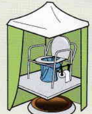
マンホールトイレ