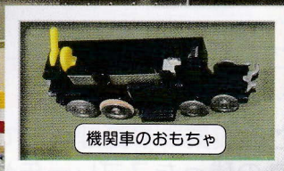
機関車のおもちゃ