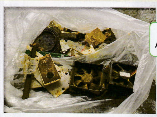
可燃ごみにプラスチック製の小型家電類が混入していました